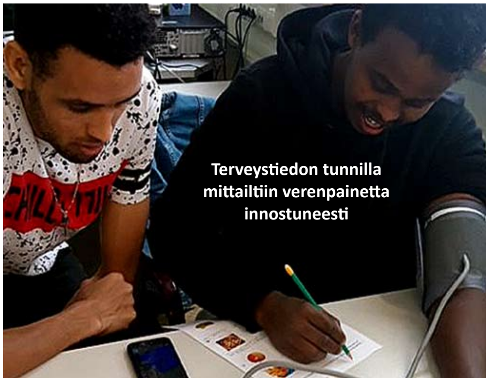
Terveystiedon tunnilla mittailtiin verenpainetta innostuneesti