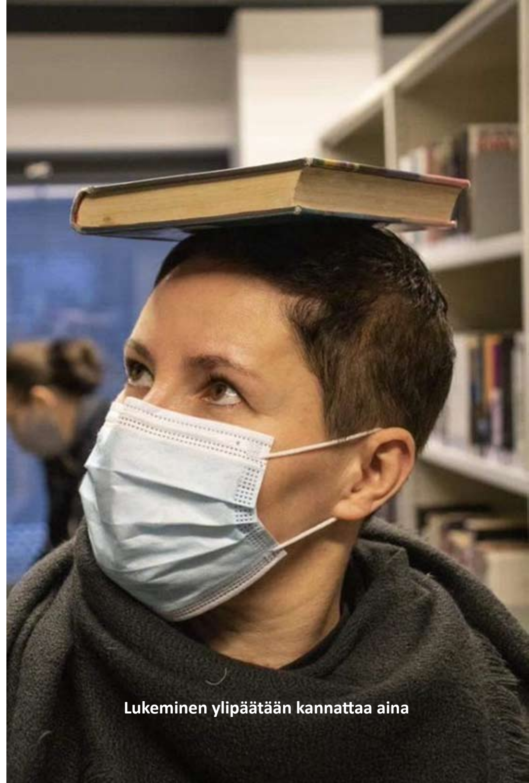
Lukeminen ylipäätään kannattaa aina