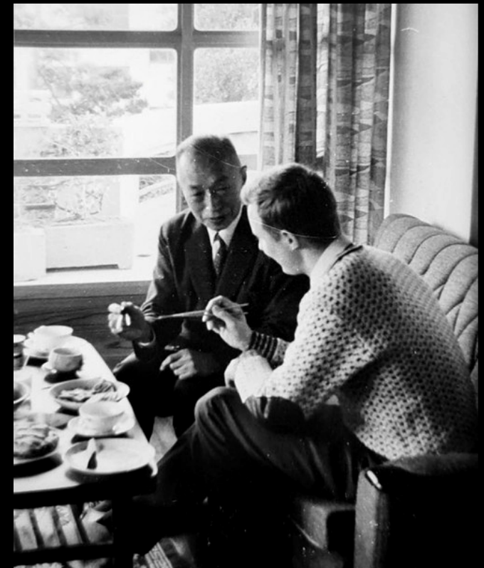
Mikage, Kobe 1970