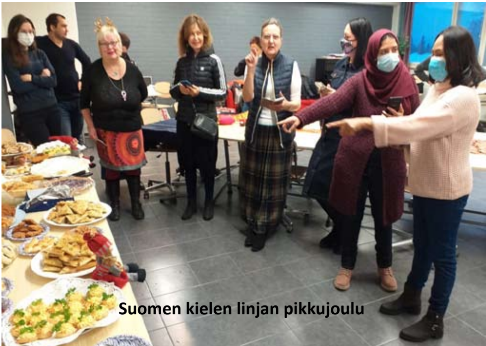
Suomen kielen linjan pikkujoulu