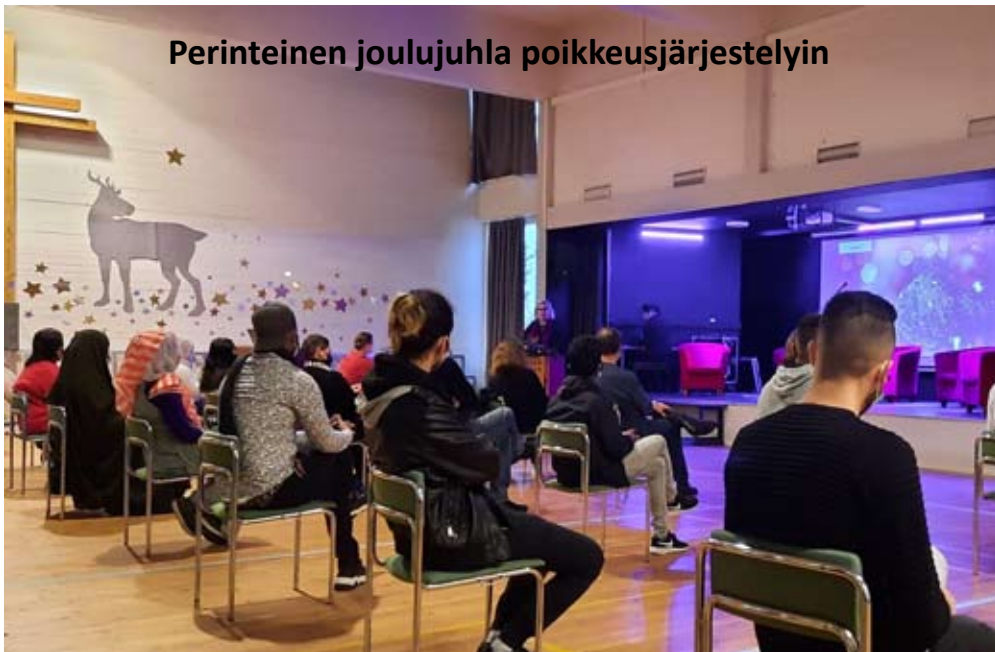
Perinteinen joulujuhla poikkeusjärjestelyin