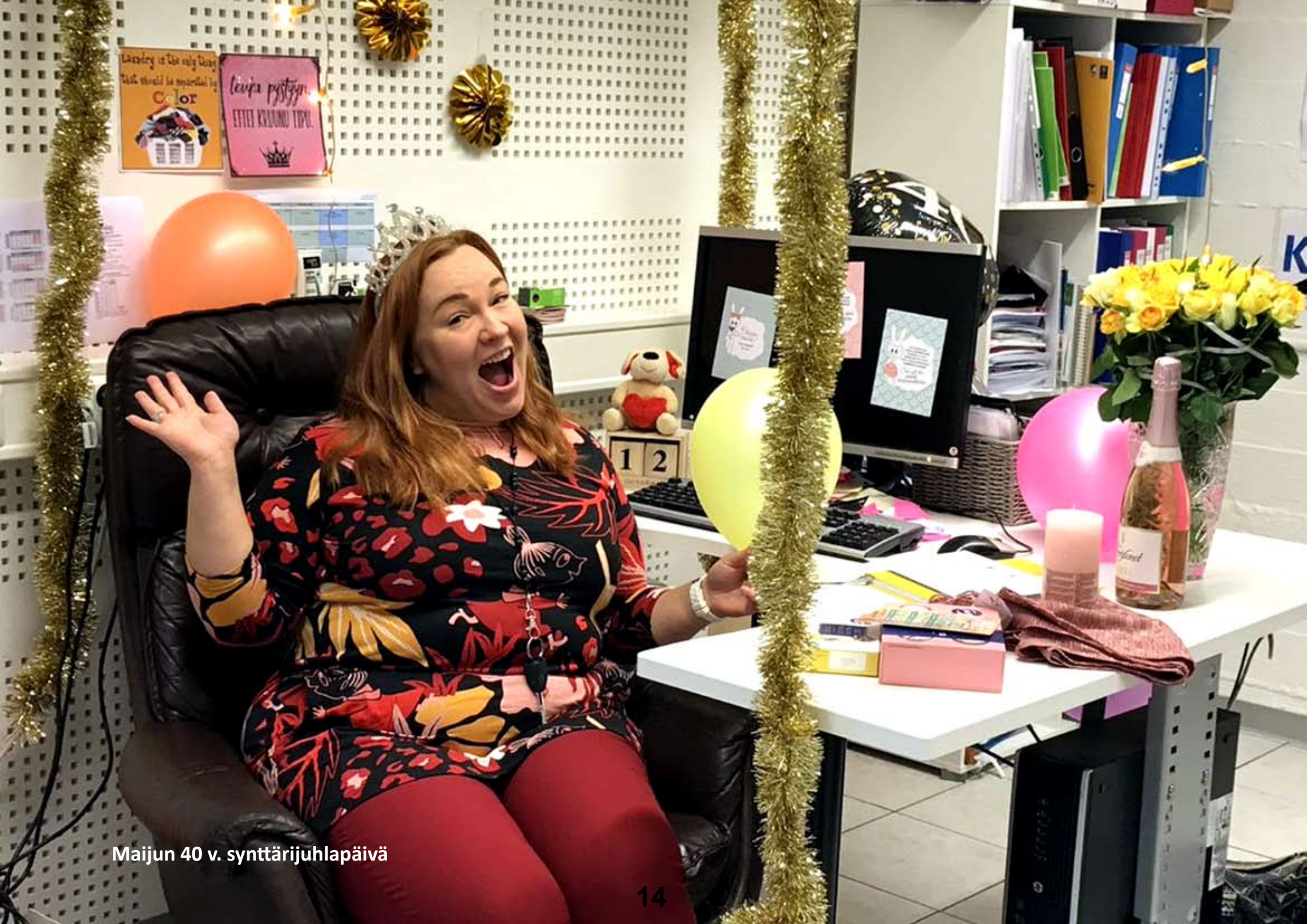
Maijun 40 v. synttärjuhlapäivä