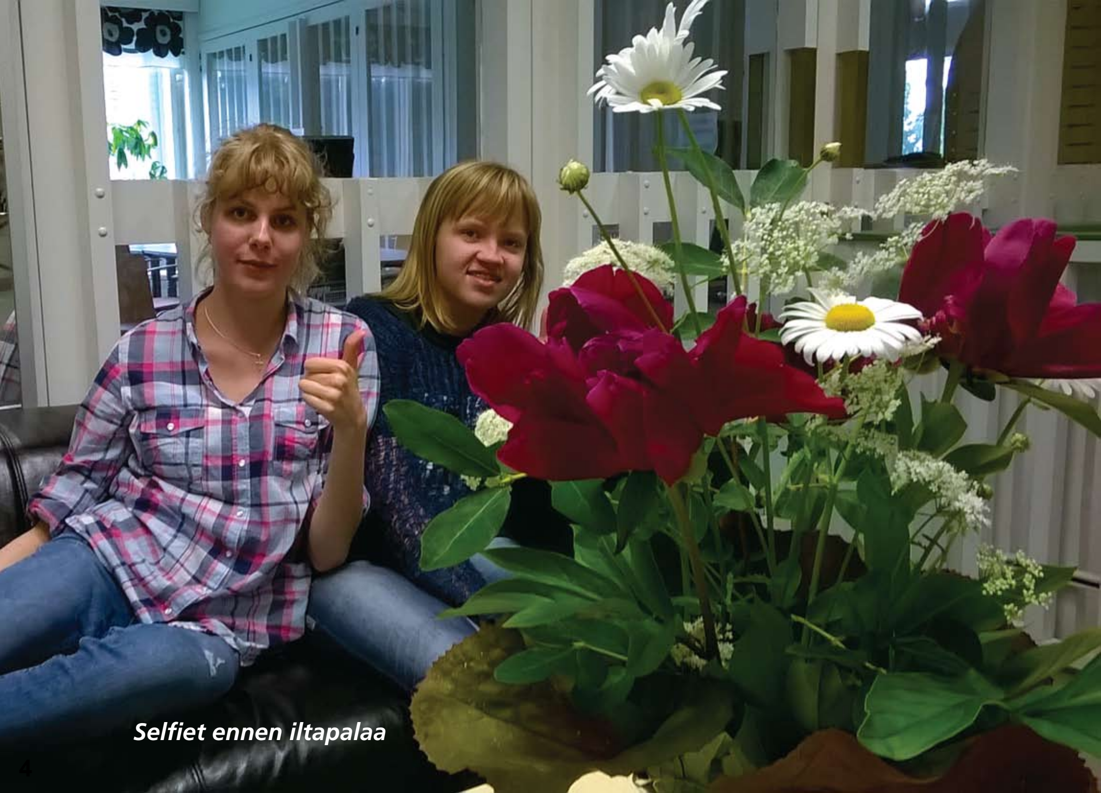
Selfiet ennen iltapalaa