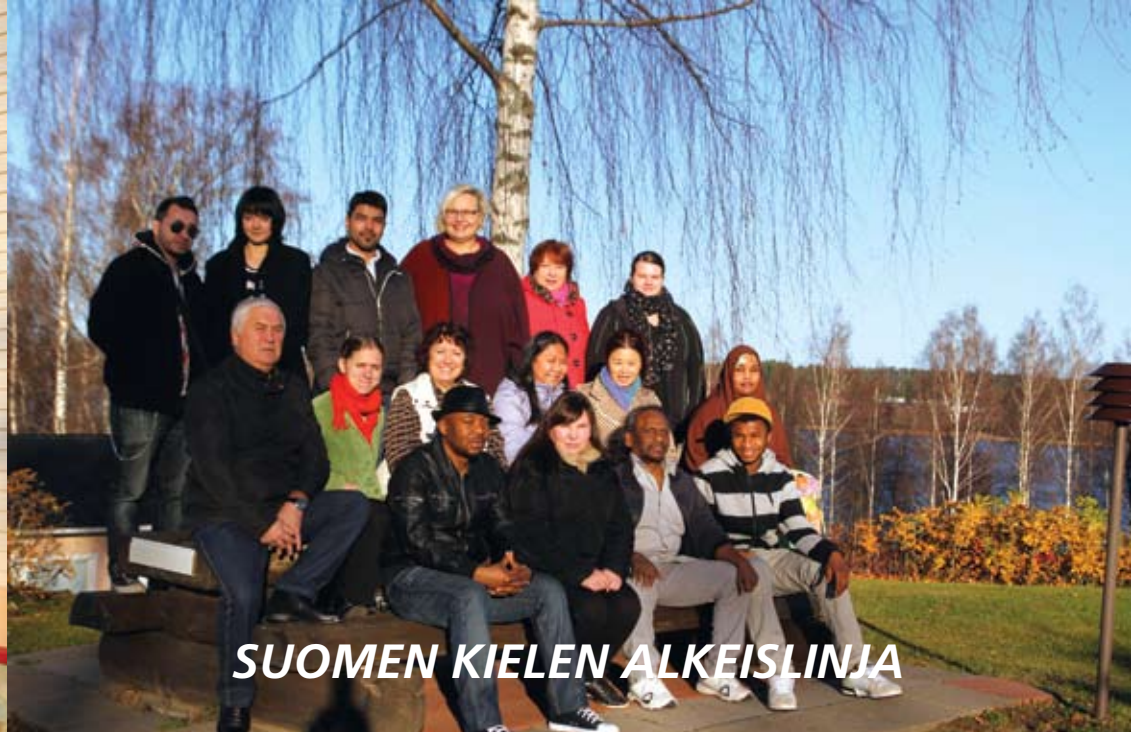
SUOMEN KIELEN ALKEISLINJA