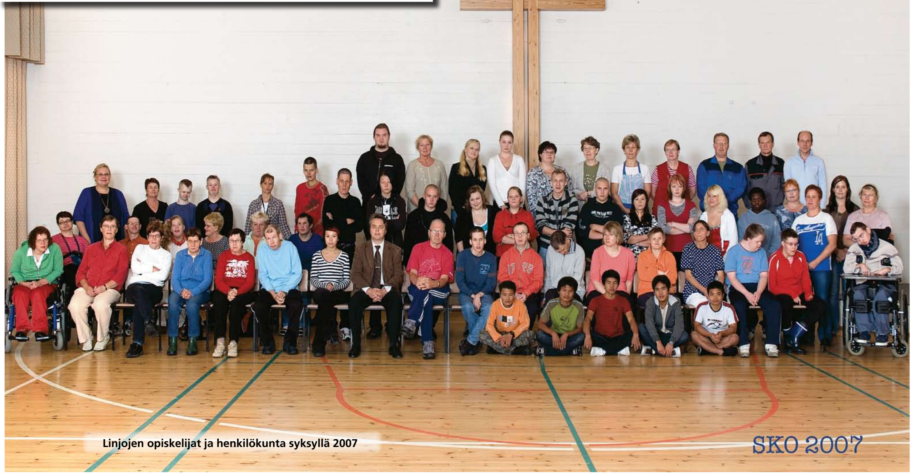
Linjojen opiskelijat ja henkilökunta syksyllä 2007