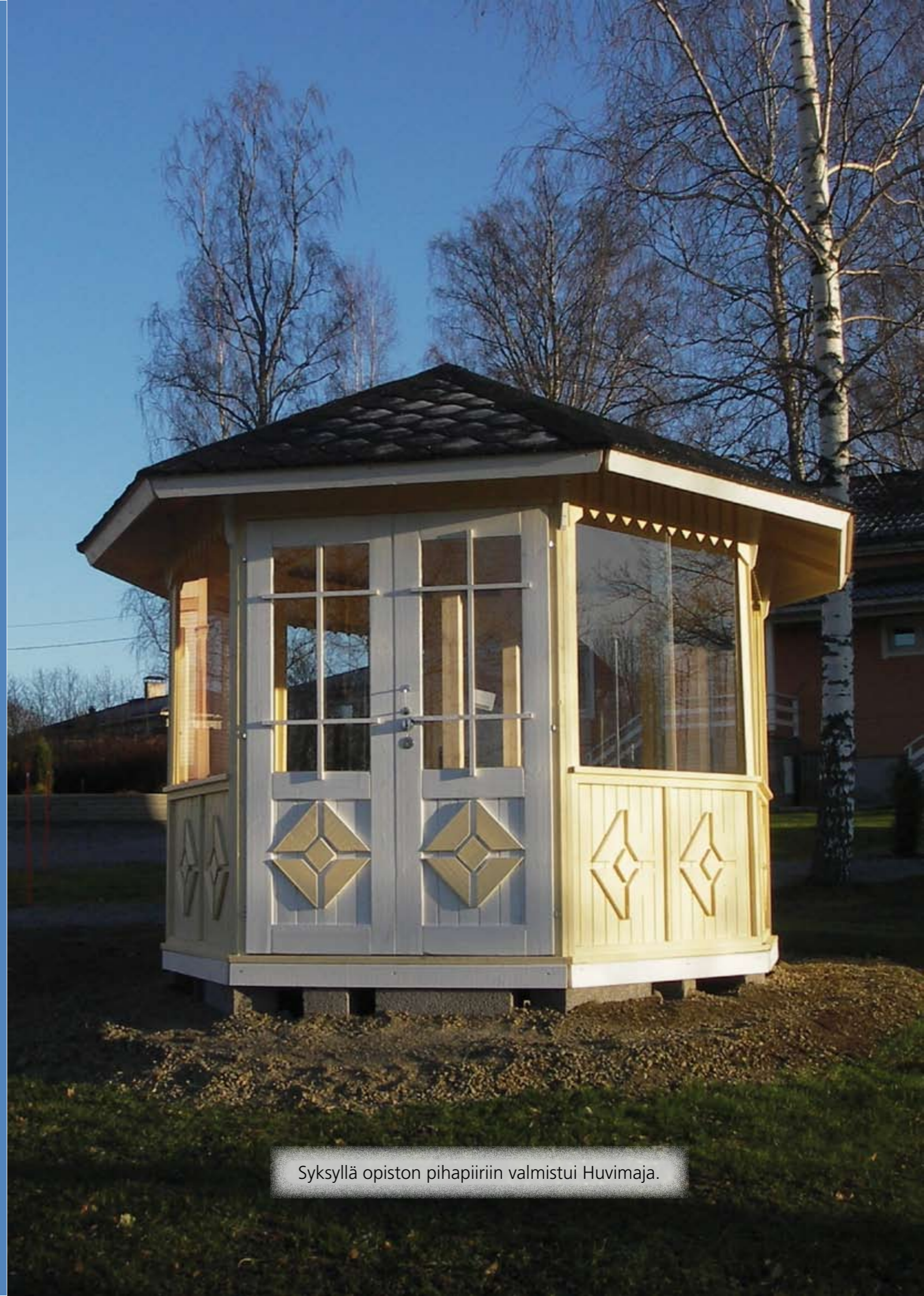
Syksyllä opiston pihapiiriin valmistui Huvimaja.