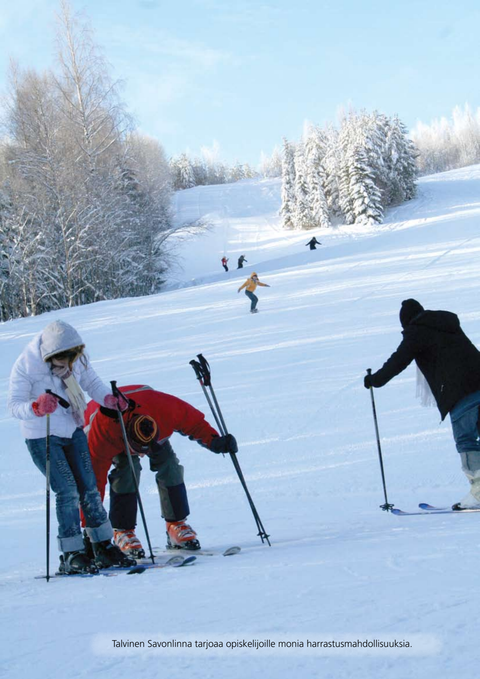
Talvinen Savonlinna tarjoaa opiskelijoille monia harrastusmahdollisuuksia.