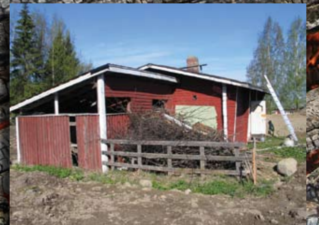
Vanha poltettiin hallitusti uuden tieltä