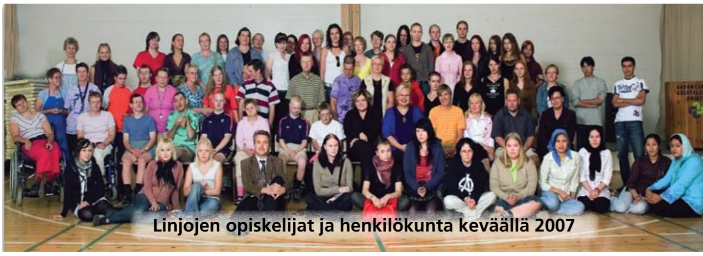
Linjojen opiskelijat ja henkilökunta keväällä 2007