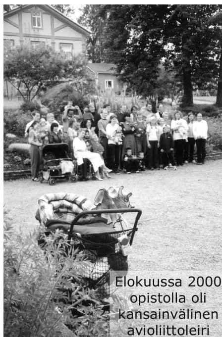
Elokuussa 2000 opistolla oli kansainvälinen avioliittoleiri

Lisäksi opistolla on käynyt vierailulla ja yöpymässä satoja yksityisiä vierailijoita ja matkailijoita monista eri maista.