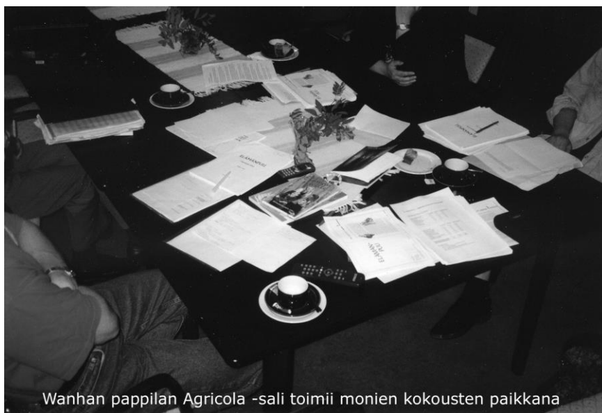
Wanhan pappilan Agricola -sali toimii monien kokousten paikkana