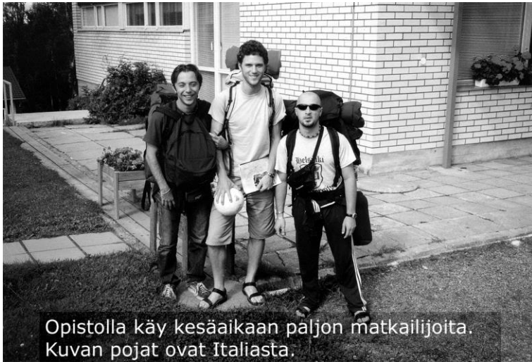
Opistolla käy kesäaikaan paljon matkailijoita. Kuvan pojat ovat Italiasta.