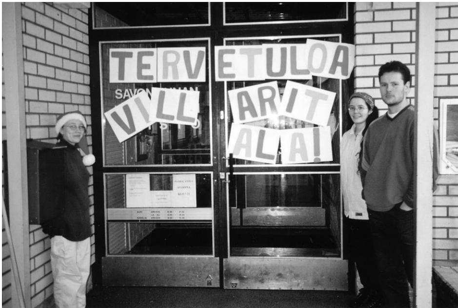
"Opisto toivotti Villa Ritalan kehitysvammaiset hoitajineen tervetulleksi Ritalanmäelle!"