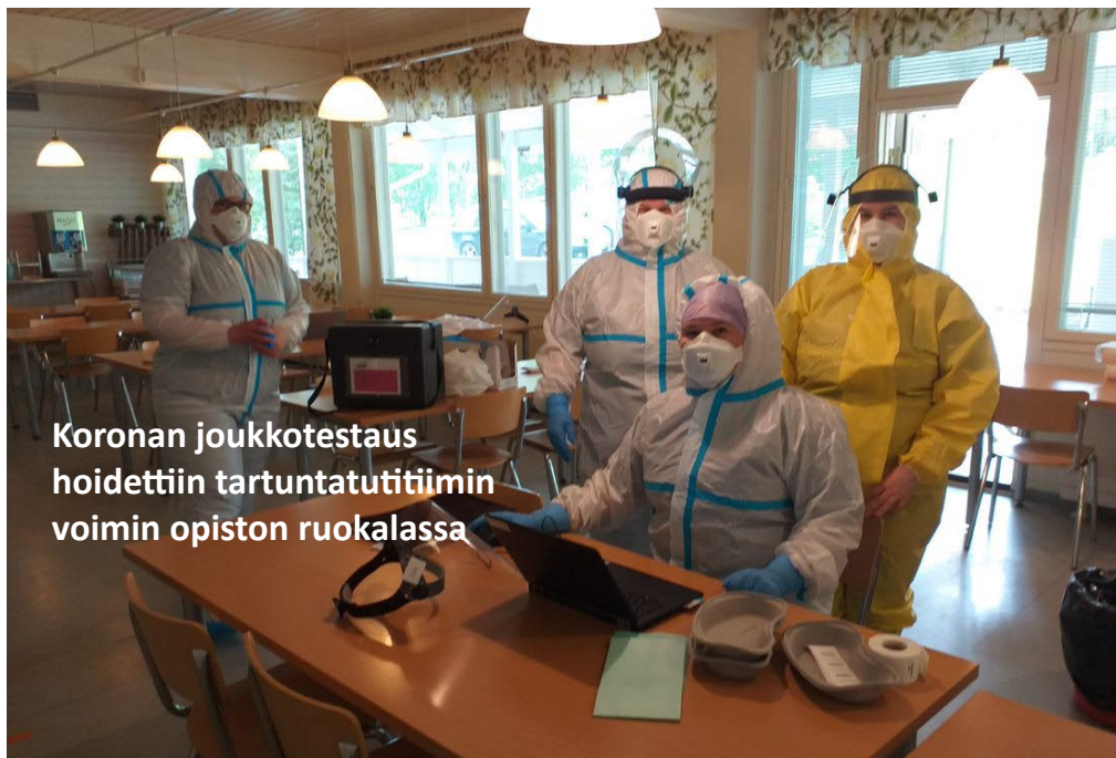
Koronan joukkotestaus hoidettiin tartuntatutitimiin voimin opiston ruokalassa