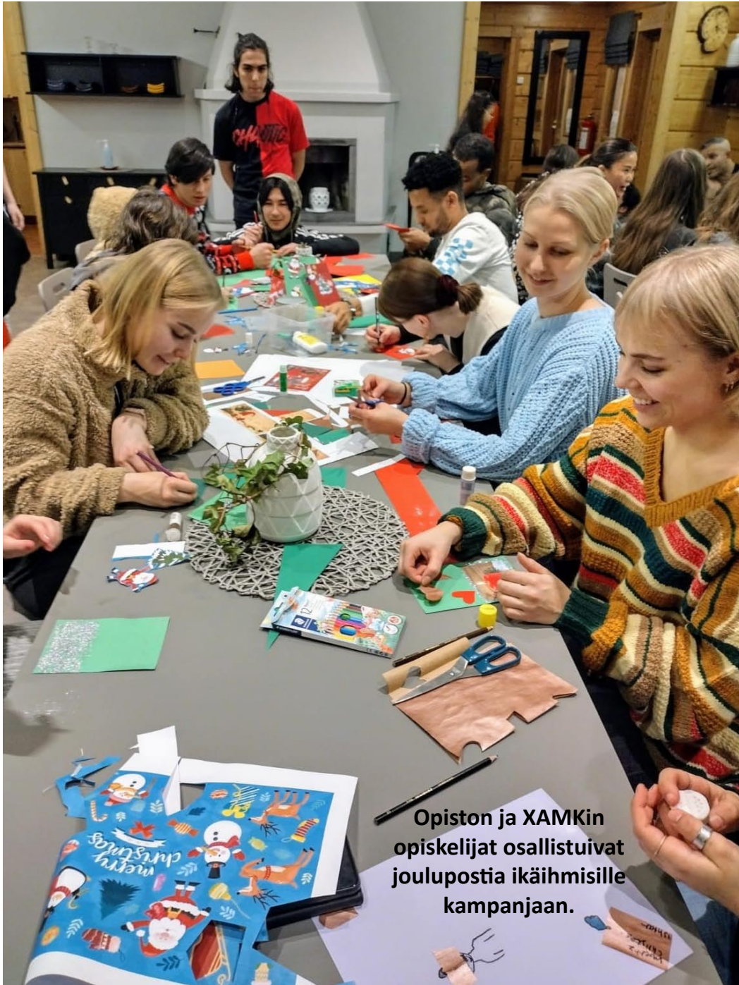
Opiston ja XAMKin opiskelijat osallistuivat joulupostia ikäihmisille kampanjaan.