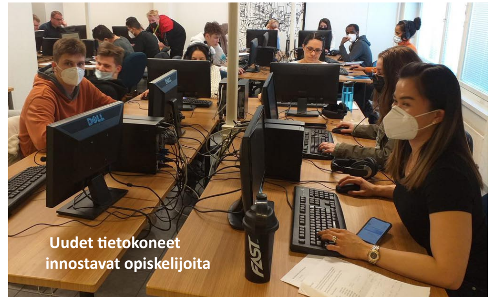
Uudet tietokoneet innostavat opiskelijoita

Suomi 2 - linjan opiskelijoiden Itsenäisyyspäiväjuhlan esitys 3.12.2021