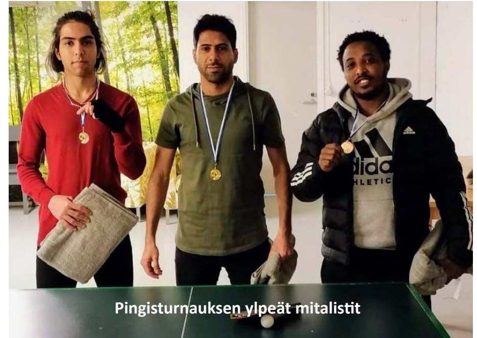
Pingisturnauksen ylpeät mitalistit