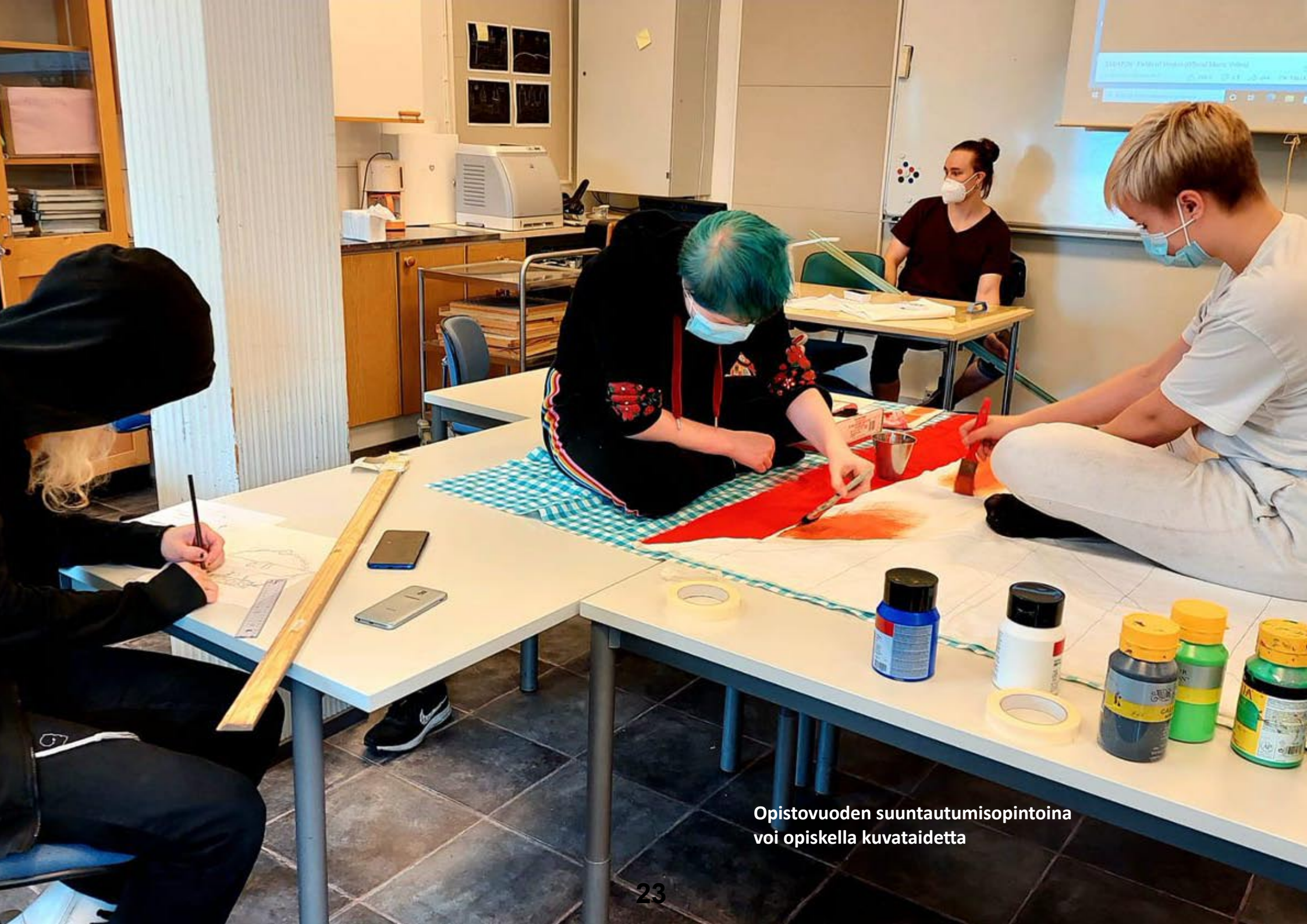
Opistovuoden suuntautumisopintoina voi opiskella kuvataidetta