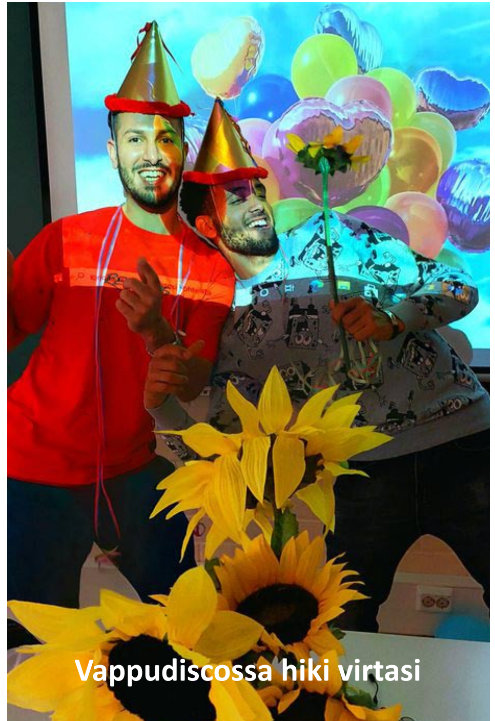
Vappudiscossa hiki virtasi