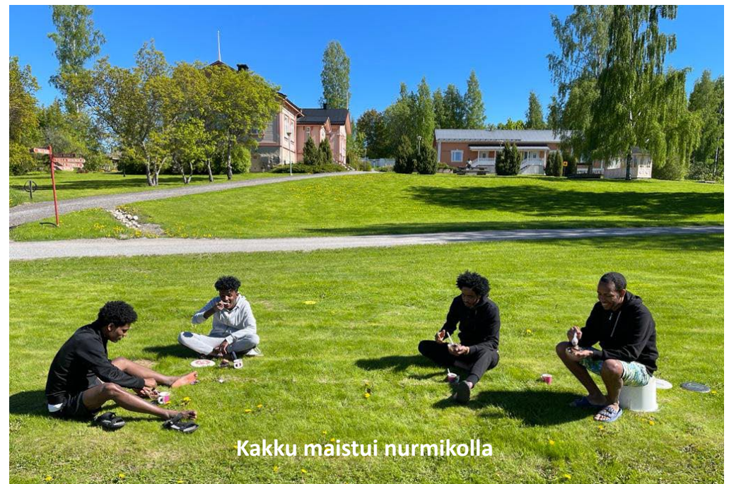
Kakku maistui nurmikolla