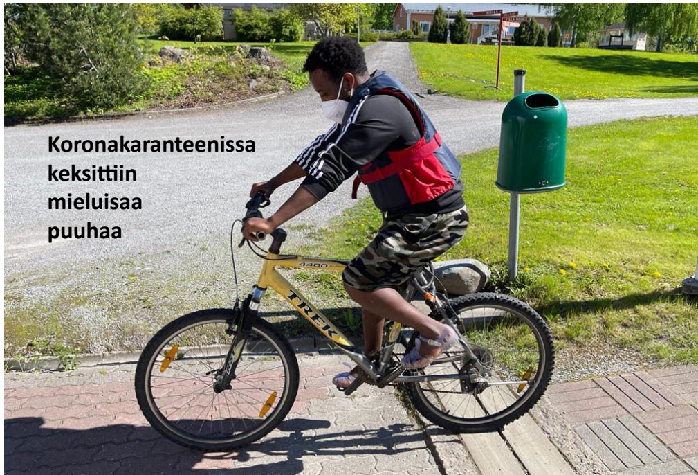
Koronakaranteenissa keksittiin mieluisaa puuhaa