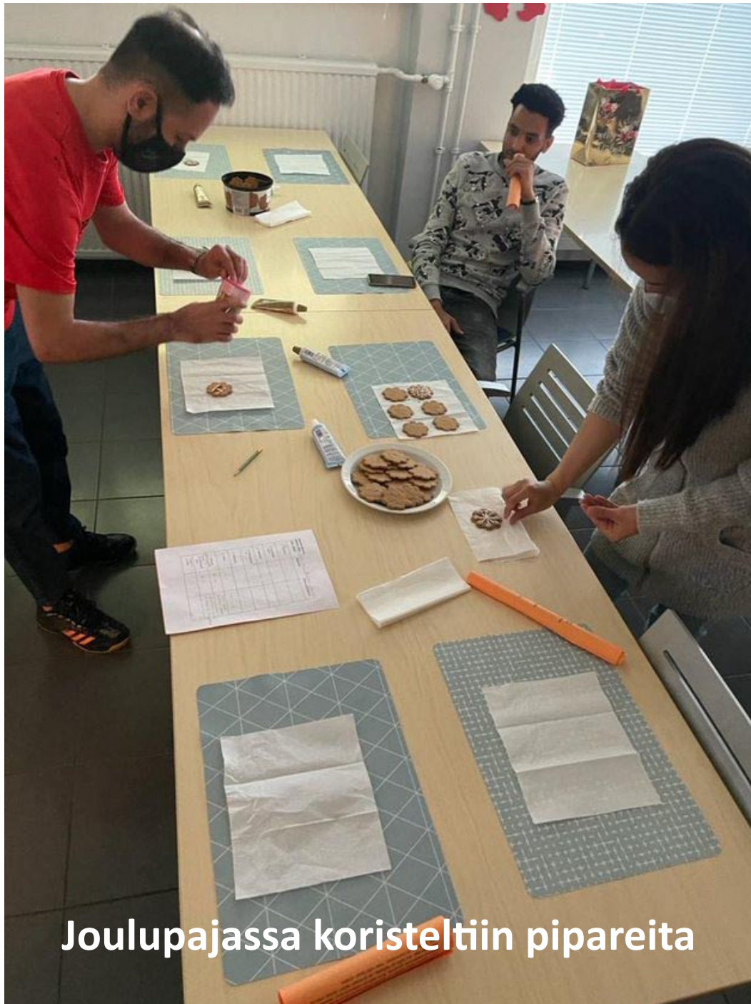
Joulupajassa koristeltiin pipareita