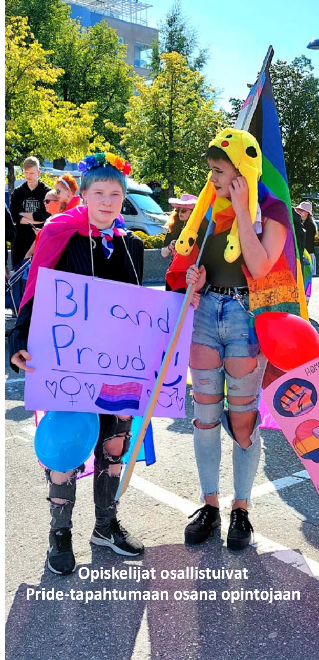
Opiskelijat osallistuivat Pride-tapahtumaan osana opintojaan