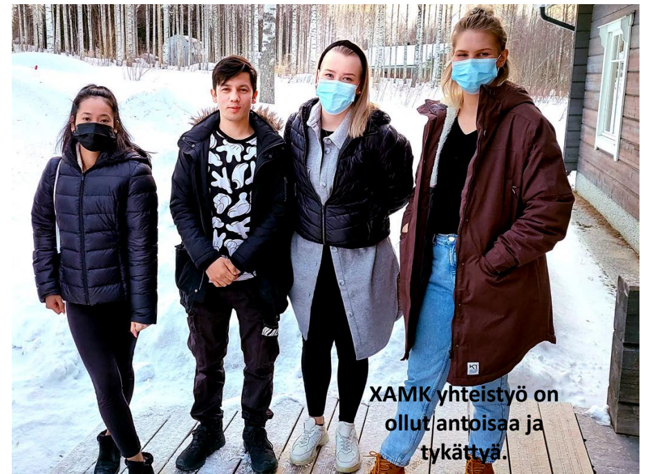
XAMK yhteistyö on ollut antoisaa ja tykättyä.