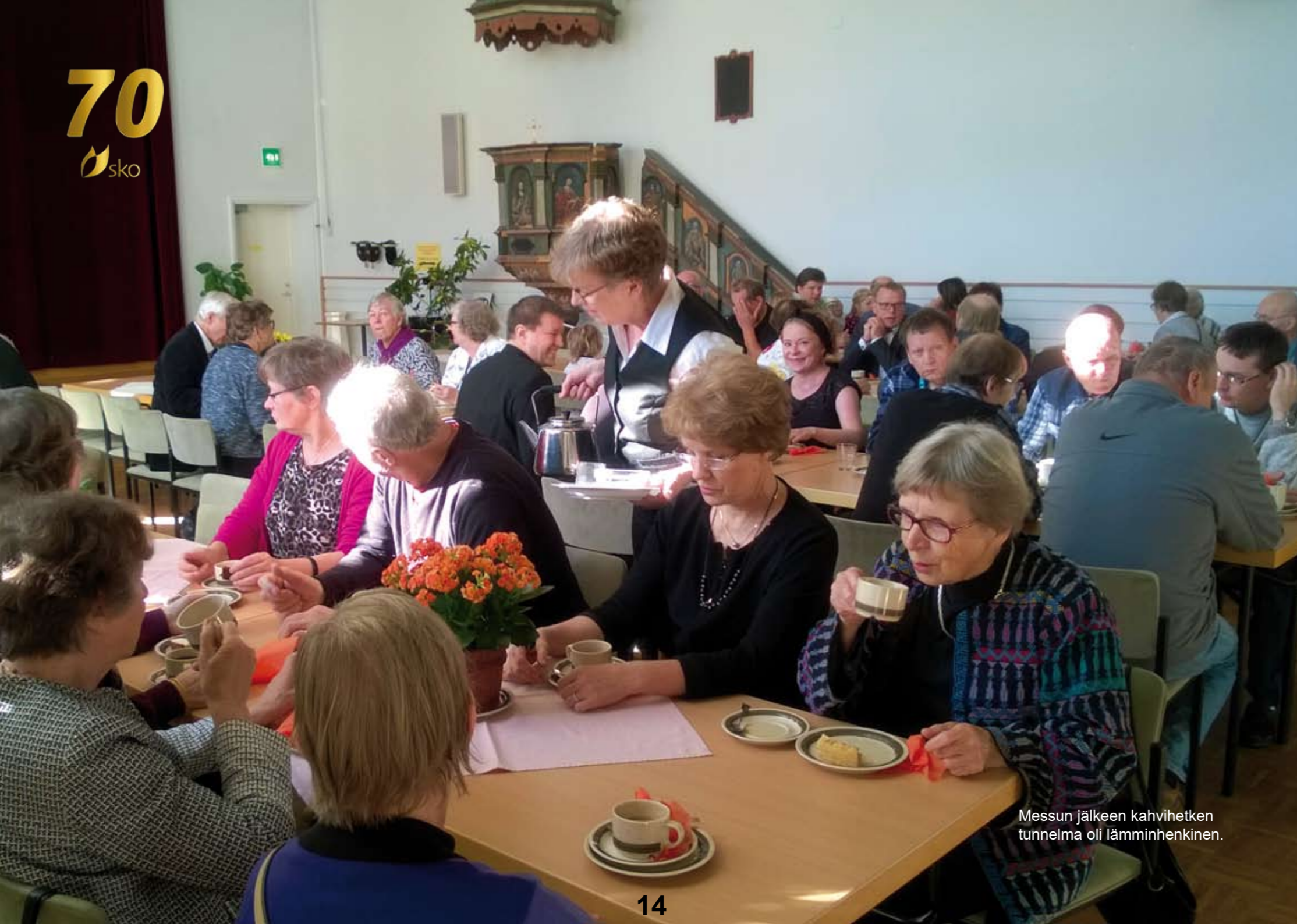
Messun jälkeen kahvihetken tunnelma oli lämminhenkinen.