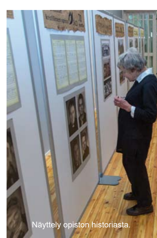
Näyttely opiston historiasta.