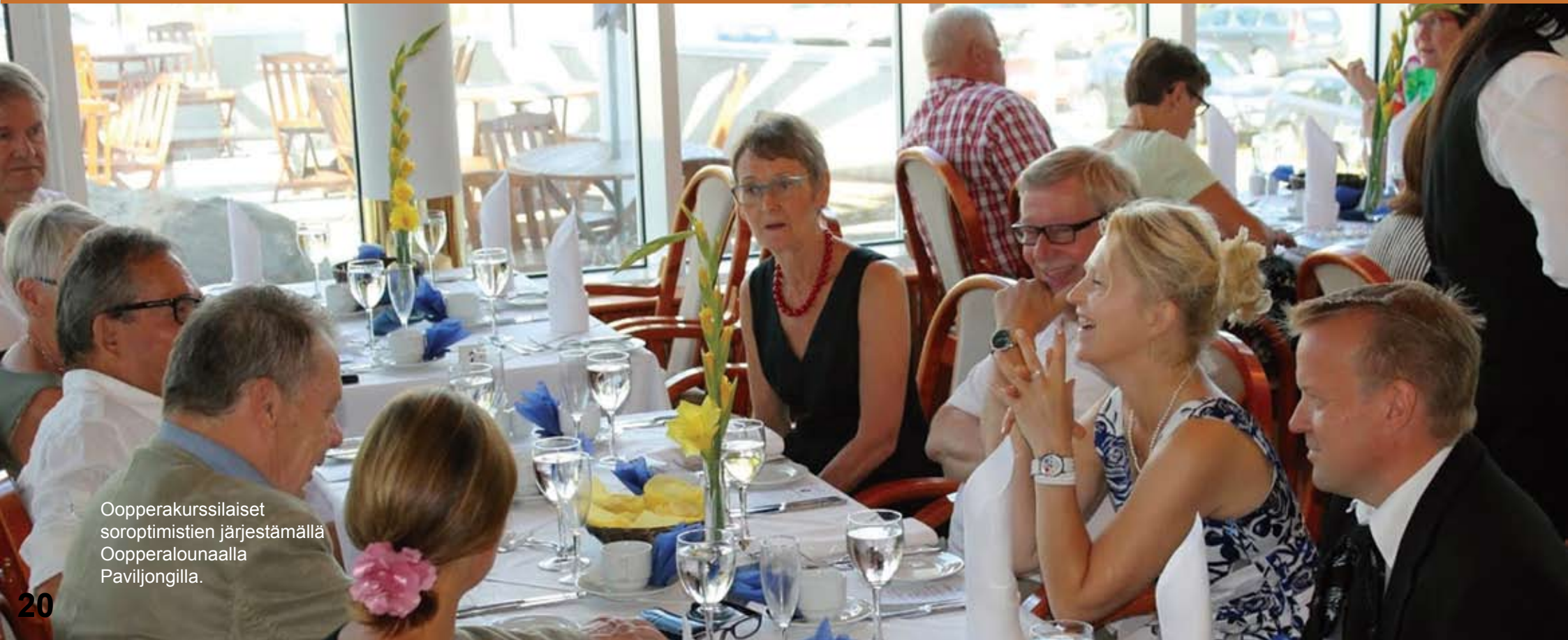
Oopperakurssilaiset sorooptimistien järjestämällä Oopperalounaalla Pavinjongilla.