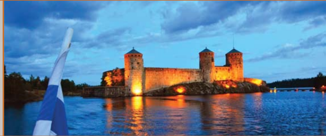
Olavinlinna ja opiston oopperakurssi – mikä yhdistelmä