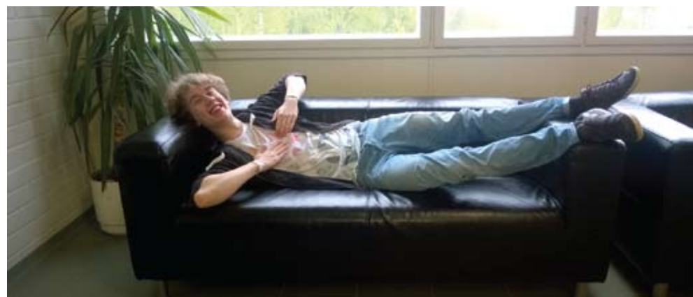
; ) Florian

I can highly recommend a voluntary year in the SKO, peculiar because you'll become an amazing condition through the long way to the city.