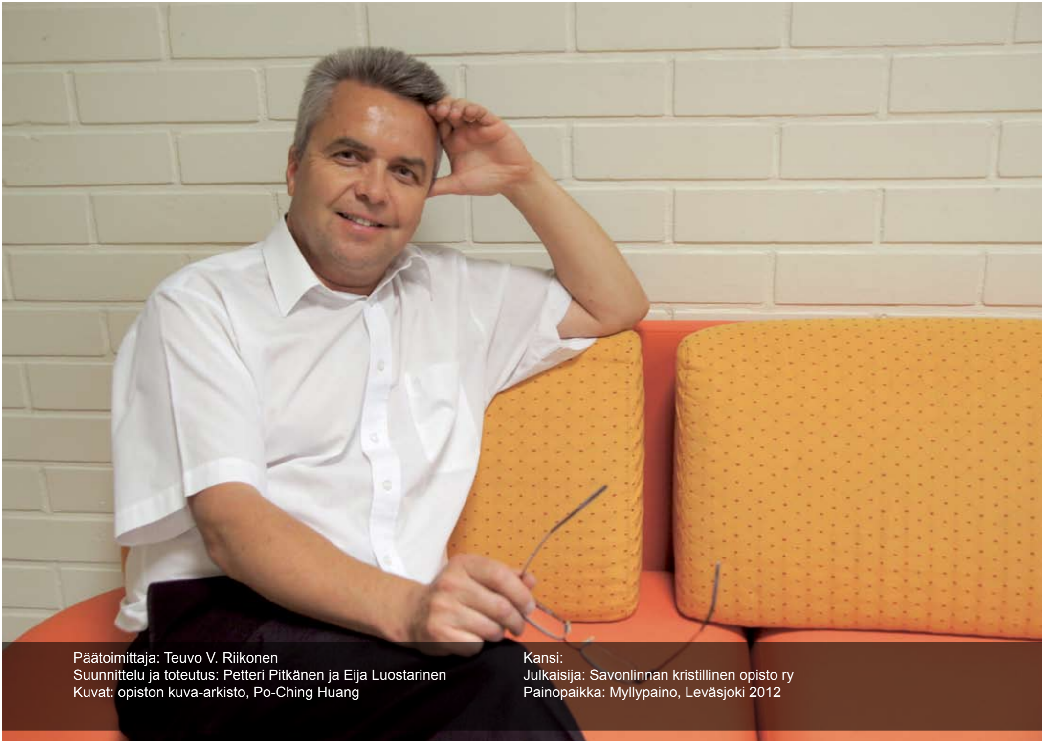
Päätoimittaja: Teuvo V. Riikonen Suunnittelu ja toteutus: Petteri Pitkänen ja Eija Luostarinen